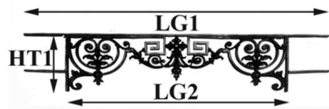
Schéma explicatif dimensionnel